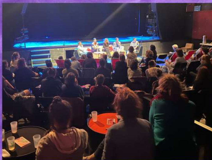
Table ronde "Les freins à l'entrepreneuriat au féminin dans la culture, des pistes pour les lever" Le 20 septembre 2022

Votre vie professionnelle parvient-elle à rester à sa place sans empiéter sur votre bien-être ? Qu'en est-il de la non-mixité dans vos quotidiens ? Les questions ont fusé. C'était aussi le début de Pitch 4 her, avec une avalanche de déclamations d'initiatives toutes aussi inspirantes les unes que les autres, mais aussi d'Essent.ielles, l'incubateur féminin d'Ecopia qui célébrait le lancement de sa première édition.