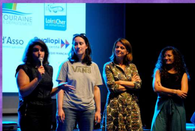
Présentation de l'incubateur culturel ESSENT.IELLES 100% pour les femmes en Région Centre-Val de Loire par ÉCOPIA

La seconde édition a souhaité être encore plus inclusive, conviant tous·tes les participants à se mettre autour de la table pour évoquer la santé mentale dans le monde culturel. L'après-midi, il s'agissait de compter la parité dans les programmations ou encore d'en savoir plus sur le congé maternité quand on évolue dans le secteur artistique... Les promesses étaient tenues : à l'affiche, tous ces sujets que nous voulions dire tout haut mais qui d'habitude, étaient évoqués tout bas.