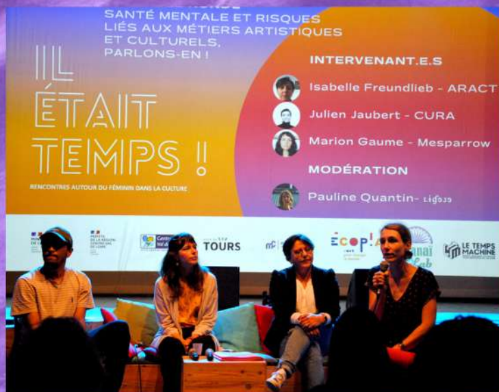
Table ronde "Santé mentale et risques liés aux métiers artistiques et culturels, parlons-en !" Le 29 septembre 2023

La seconde édition a souhaité être encore plus inclusive, conviant tous·tes les participants à se mettre autour de la table pour évoquer la santé mentale dans le monde culturel. L'après-midi, il s'agissait de compter la parité dans les programmations ou encore d'en savoir plus sur le congé maternité quand on évolue dans le secteur artistique... Les promesses étaient tenues : à l'affiche, tous ces sujets que nous voulions dire tout haut mais qui d'habitude, étaient évoqués tout bas.