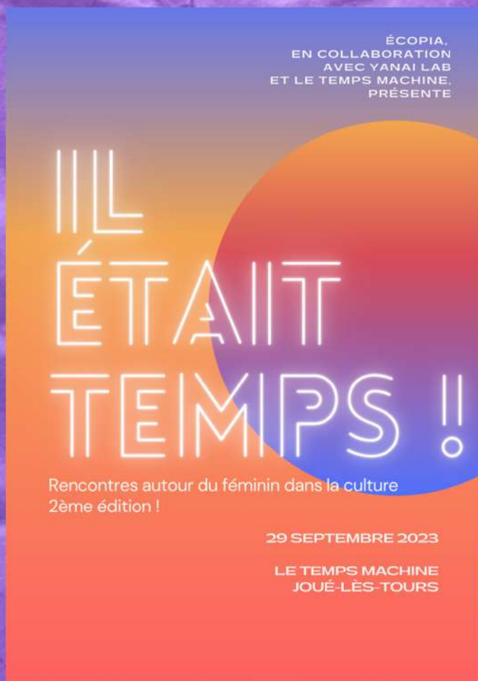
Visuel de la 2e édition "Il était temps !"